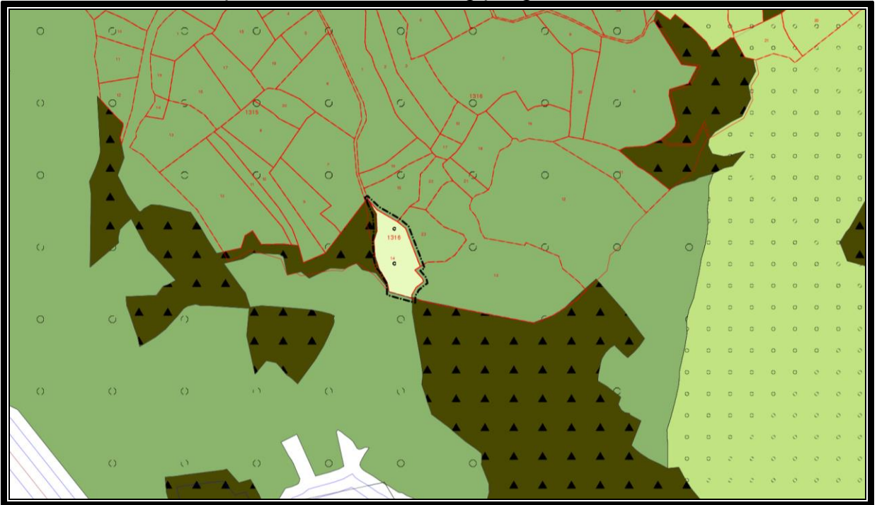
Şekil-6 Öneri 1/5000 Ölçekli Nazım İmar Planı Değişikliği

Değişiklik ile 1316 ada 14 parsel üstte belirtilen hususlar doğrultusunda, “Tarım Alanı” olarak planlanmıştır. Mekansal Planlar Yapım Yönetmeliği’nin geçici 3. maddesi uyarınca bahse konu taşınmaz plan değişikliğinde meri mevzuattaki gösterim şekli ile tanımlanmıştır. Planlama alanında değişiklik ile nüfus artışı yapılmadığından ilave sosyal ve teknik altyapı alanı önerilmemiştir.