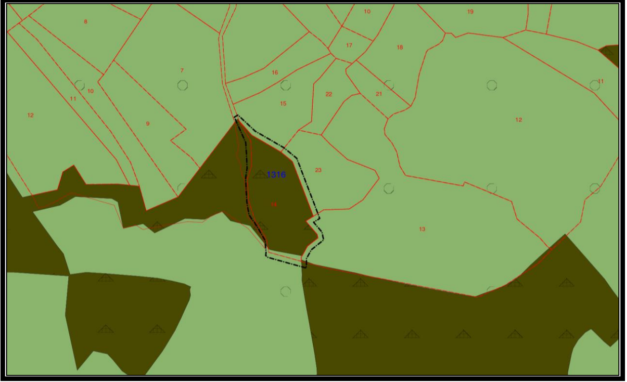
Şekil-4 Mevcut 1/5000 Ölçekli Nazım İmar Planı